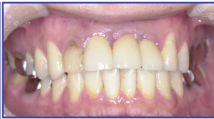
症例1 上部構造物装着後4年経過時 2009年11月10日