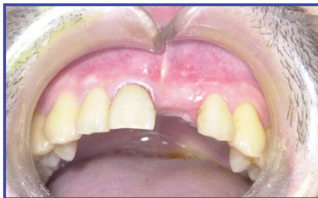
症例1 一次手術前 2005年6月13日