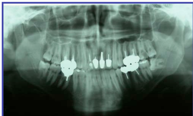
症例1 初診時 2005年3月6日